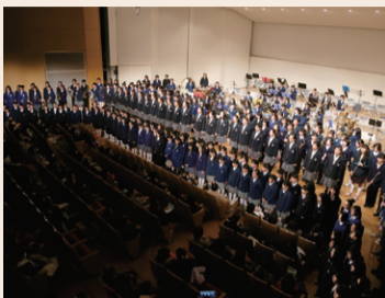
右京ふれあい合同演奏会 昨年の様子

右京区内中学校の吹奏楽部と音楽部による合同演奏会。中学生たちが地域の仲間と音楽を通じて交流を深めます。 時2月5日(日) 13時~16時30分(12時30分開場) 所 右京ふれあい文化会館ホール 定48名(先着順) 主催 京都市、右京ふれあい文化会館 共催 右京ふれあい合同演