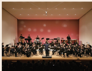
NEO吹奏楽団 昨年の様子

創団30周年を迎えるNEO吹奏楽団によるコンサート。 時2月19日(日) 14時~16時(13時30分開場) 所 右京ふれあい文化会館ホール 内 吹奏楽オリジナル作品「シンフォニック・ダンス」、連続テレビ小説「あさが来た」テーマ曲「365日の紙飛行機」、「ゴジラ」ファンタジー、「ドラゴンクエスト」などを演奏。