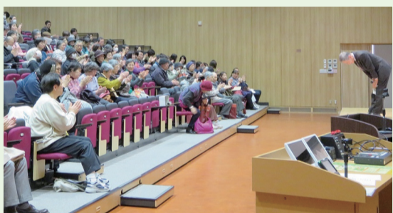
右京医師会市民公開講座 昨年の様子

右京医師会は、15の医療機関、219人の会員が所属する、市内でも有数規模の地区医師会です。地区医師会としては全国的にも珍しい訪問看護ステーションやケアマネジャーがいる居宅介護支援事業所を併設し、医療と介護の連携に力を入れています。 〈検診事業〉 区内32カ所で集団特定健康診査のほか、がん検診事業(胃がん、大腸がん、乳がん)を行っています。年に1回は健康診断を受けるようにしましょう。検診日程などは、