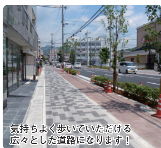
気持ちよく歩いていただける 広々とした道路になります!

10月24日に、梅津太秦線(右 京区大秦垣内町〜常盤東ノ 町)の拡幅工事が完了します。 観光シーズンの混雑緩和も期 待されます。 園市道路建設課 ☎222・3577