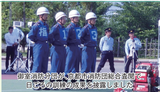
御室消防分団が、京都市消防団総合査閲で、日ごとの訓練の成果を披露しました。