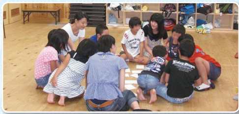
昔の生活や遊びをカードを使って子どもたちに伝えています (京都光華女子大学)