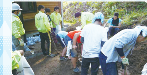
台風18号による被害に学生ボランティアが駆け付けました (花園大学)

右京区には、まちづくりに積極的な学生さんが多く、心強く思っています。これからも「右京の盛り上げ隊」として私たちと頑張りましょう！