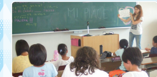
留学生が、小学生へ異文化を伝えています (京都外国語大学)