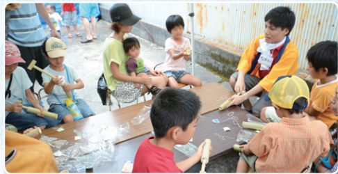
商店街の活性化に取り組む学生が、夏祭りで大活躍！ (京都外国語大学)