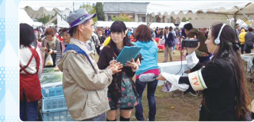
右京の魅力を学生の視点から取材・発信(写真はふれあいフェスティバル) (京都光華女子大学)

右京区では、多くの学生が「右京区を良くしたい」との思いから、地域行事に参加したり、まちづくり活動に取り組んでいます。地域住民と学生が連携して、右京区を盛り上げていきましょう！