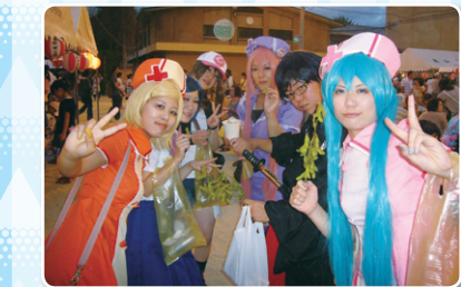
地元の夏祭りにコスプレで参加！祭りを盛り上げました (京都嵯峨芸術大学)