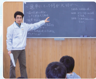
小学生に、選挙について学ぶ前授業を行いました (花園大学)