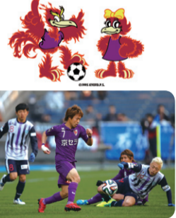
西京極総合運動公園陸上競技場兼球技場