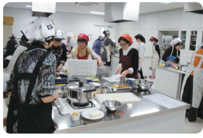
食育セミナー 調理実習の様子

「京クッキング」 〒、住所、氏名、電話番号、「食育セミナー参加希望」、希望の日程を明記のうえ、〒616-8511(住所不要)右京区役所 右京保健センター 健康づくり推進課 成人保健・医療担当へ 医療担当へ ※5月28日(水)必着 〒616-2177