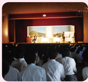
演劇鑑賞教室の様子

地域で育み、伝える文化芸術 9月28日、太秦中学校で第1回演劇鑑賞教室「明日へのとびら」(NPO法人ハートフル演劇・製作所)制作が開催されました。