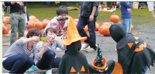
10月7日、「右京ハロウィン祭2012」が開催され、約110名の親子連れが参加し、ジャンボかぼちゃでランタン作りを楽しみました。