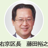
右京区長 藤田裕之

「おこしやす! 区長の部屋」 右京区役所 Facebook 日々更新中! ぜひのぞいてみてね!