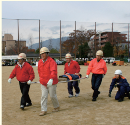
応急救護訓練の一例

右京区内の防災関係機関で構成する右京区防災会議では、住民の皆様との連携強化を図るため、直下型地震の発生を想定した「右京区総合防災訓練」を実施します。 日時 12月4日（日） 午前9時～正午頃 場所 京都市立高雄小学校 訓練の内容 土砂災害救出訓練や応急救護訓練などを予定。 ※今年度は高雄学区の皆様を中心に実施します。 お問合せ 総務課 ☎861・1784