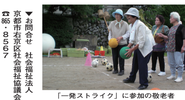
「一発ストライク」に参加の敬老者

京都・嵐山花灯路2011 今年で7回目を迎える京都・嵐山花灯路。今年も渡月橋周辺や竹林の小径のライトアップ、寺院・神社などの特別拝観とライトアップが催されます。豊かな自然と歴史的文化遺産に恵まれた嵯峨・嵐山地域の普段とは違う幻想的な姿にふれてみませんか。灯りも花もつつまれた初冬の嵐山にぜひお越しください。 日時 12月9日(金)～18日(日) 点灯時間 午後5時～午後8時30分 (雨天決行) ▼お問合せ 京都・花灯路推進協議会 ☎212・8173