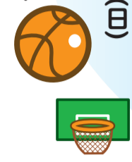
会場 ハンナリーズアリーナ

11月5日(土)、11月6日(日) 大阪エヴェッサ戦 区民の皆様へ 当日チケットのご優待！ チーム創設3年目を迎える今年、新たに浜口ヘッドコーチのもとリーグ優勝を目指す京都ハンナリーズ。 レギュラーシーズン前半の一番、ライバル大阪エヴェッサを西京極のハンナリーズアリーナに迎える京阪タービーズ連戦！ この度、右京区制80周年を記念して地元右京区の皆様は特別ご優待価格にて試合を観戦いただけます。区民の皆様は声援で大阪から初勝利を勝ち取りましょう！ 日時 11月5日(土) 午後6時 ティップオフ 11月6日(日) 午後2時 ティップオフ ▼お問合せ 京都ハンナリーズ ☎090-553635588 会場 ハンナリーズアリーナ(西京極総合運動公園内) 優待内容 区民デーの試合当日、当日券売場に本紙又は区役所設置、区民ふれあいフェスティバルにて配布の優待チラシをご提示いただく、大人・子どもとも、お一人様50円にてスタンド自由席で観戦いただけます。 水当日は試合会場にて区民の皆様はフリースローイベントをお楽しみいただけます。イベント参加人数に限りがありますのでお早めにご来場ください。