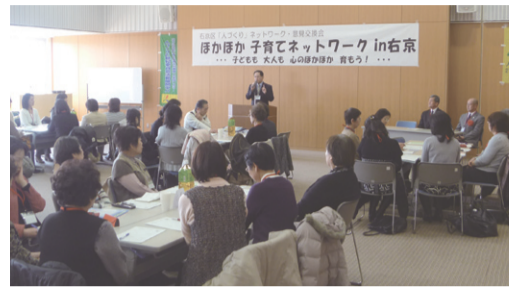
昨年の同企画の様子

右京区「人づくりネット」ワーク実行委員会では、子育てについていろいろな世代を交えて気軽に語り合う会を開催します。 日時 11月9日(水)午後1時半～4時10分受付午後1時～ 場所 サンサ右京 5階会議室 対象 右京区にお住まいの方(ごなたでも参加できます。お子様連れも可) 定員 80人程度(先着順) 費用 無料 申込方法 住所、氏名、電話番号を電話、FAX、Eメールのいずれかで。 主催 右京区人づくりネットワーク実行委員会 共催 右京区役所 ▼お問合せ・申込み 市教育委員会生涯学習部 ☎251-0456、FAX251-0449、Eメールアドレス info@h2k-net.jp