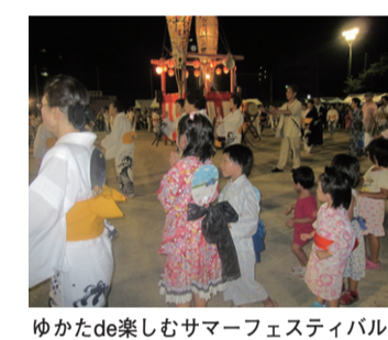
ゆかたde楽しむサマーフェスティバル

右京区制80周年を盛り上げよう！ 今年が誕生して80年目の節目の年であり、様々なイベントが実施されています。 8月6日には、「ゆかたde楽しむサマーフェスティバル」が四草中学校にて開催されました。8千名を超える区民の皆様が来場していただき、各団体・大学・企業などのフリースタイル大賑わい！各分野、各地域の皆様が、右京のまちづくりに熱い思いを共有し、再確認していただく。