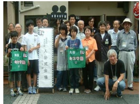
右京区まちづくり支援事業 「太秦キネマ塾」