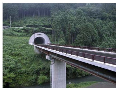
国道162号川東第一工区