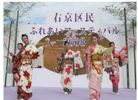
右京区民ふれあいフェスティバル