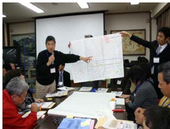
ワークショップの実施