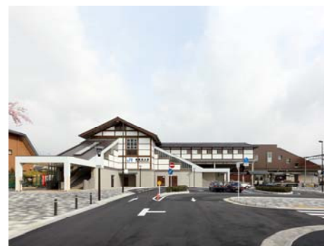
橋上化されたJR山陰本線 嵯峨嵐山駅

○京北地域水道整備事業（弓削，黒田簡易水道の整備，京北中部，細野簡易水道の認可設計） （上下水道局）