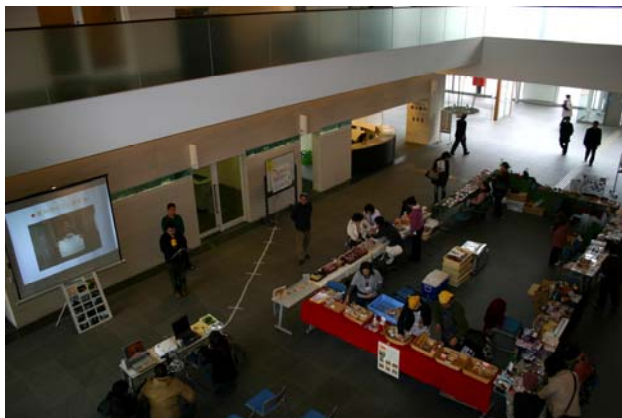
授産施設製品展示販売