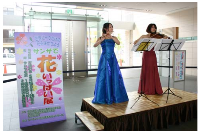
サンサで花いっぱい展(21年5月)