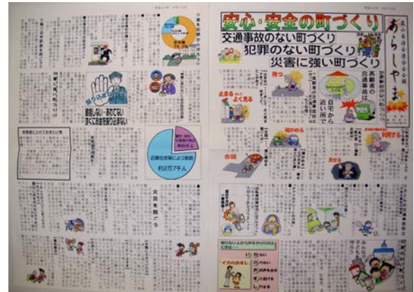
まちづくりニュース