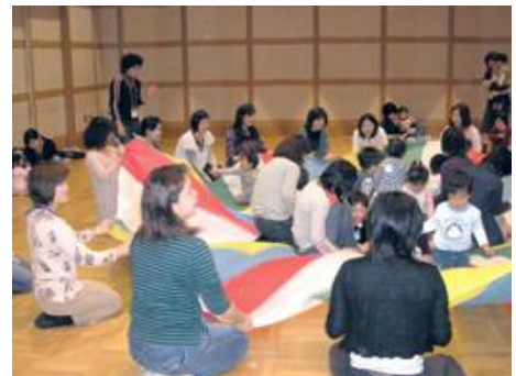
右京ふれあい親子広場（地域子育て支援ステーション）