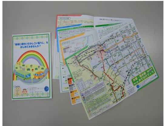
昨年度のお出かけマップ