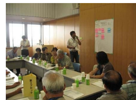
ブロック毎に検討結果について発表してもらいました。