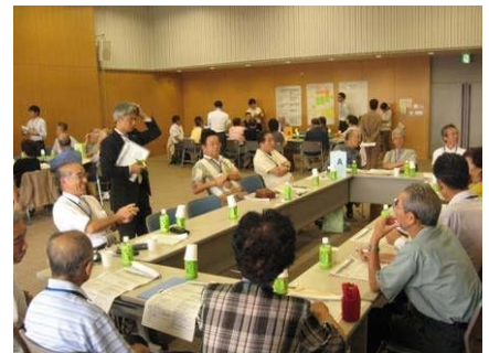
最初は 3 つのグループに分かれて知恵や工夫を出し合いました。