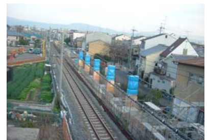
JR山陰本線の 複線高架化