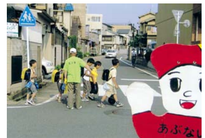
安心安全ネットワーク 形成事業