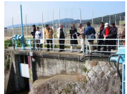
梅津学区防災 ワークショップ

右京区基本計画「右京来夢らいと計画21」の推進組織である「右京区まちづくり円卓会議」と相互に協力しあって，同計画に掲げる施策・事業を積極的に推進します。