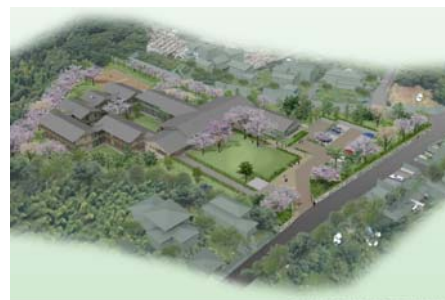
宇多野ユース・ホステル 完成イメージ図