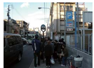
東大路通におけるバス待ち状況