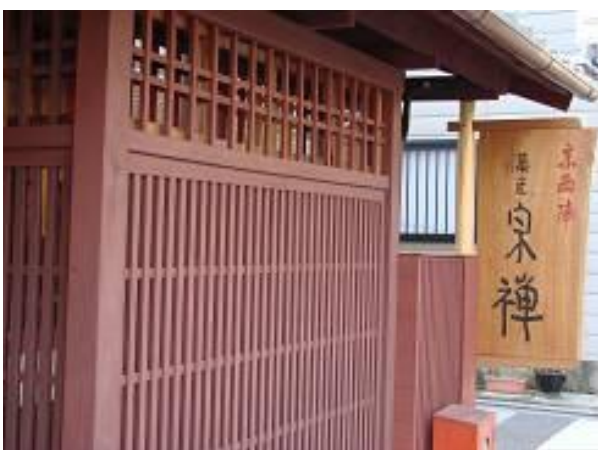
平成21年度 京西陣菓匠宗禅