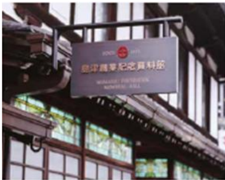
島津製作所 創業記念資料館