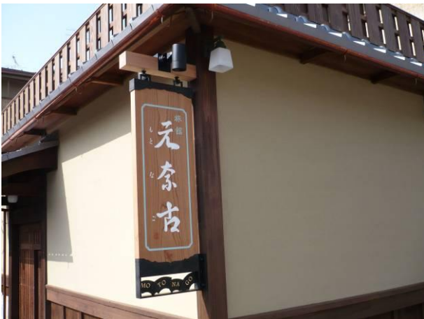
平成19年度 旅館元奈古