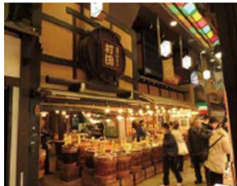
打田漬物商工業株式会社 錦小路店