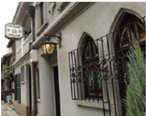
フランソア喫茶室