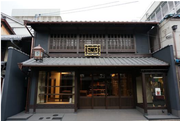
～ 平成25年度京都景観賞市長賞受賞～