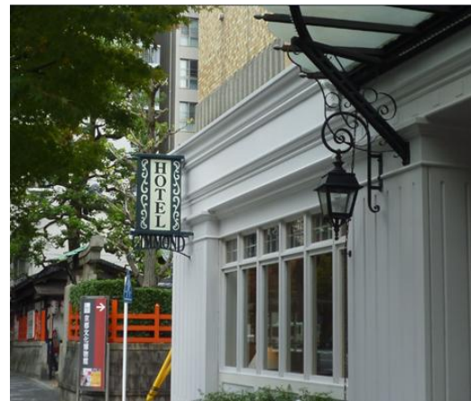
平成26年度 ホテルギンモンド京都