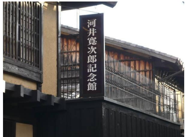
平成20年度 河井寛次郎記念館