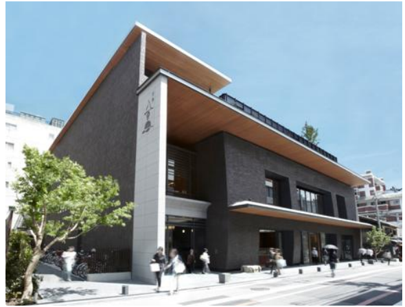
～ 平成25年度京都景観賞市長賞受賞～