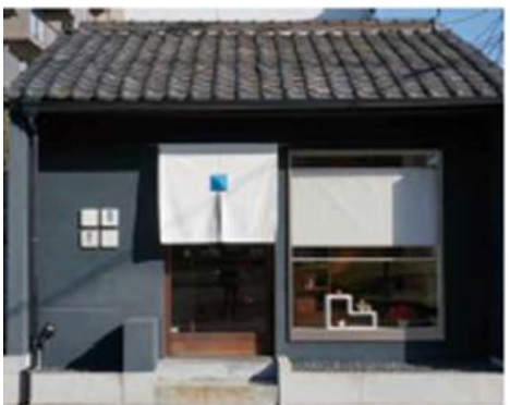
平成25年度 市長賞 群青