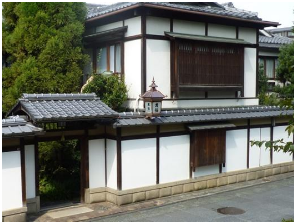
～ 平成24年度京都景観賞優秀賞受賞 ～