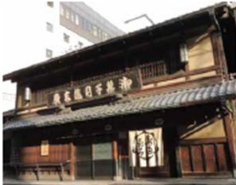
平成24年度 市長賞 亀末廣