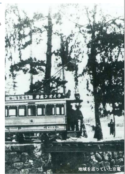
地域を巡っていた京電