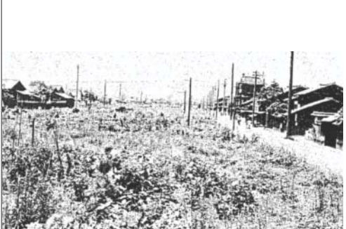
強制疎開後の御池通（烏丸御池から西を望む）

第二次世界大戦末期の昭和20年に御池通の鴨川西岸から堀川通までの民家に対して、空襲からの類焼防止策のため強制疎開が実施されました。御池通が強制疎開の対象として選ばれた理由は、戦前に拡張整備が行なわれていた丸太町通、四条通の間に類焼防止帯を設けると考えに基づいたものでした。