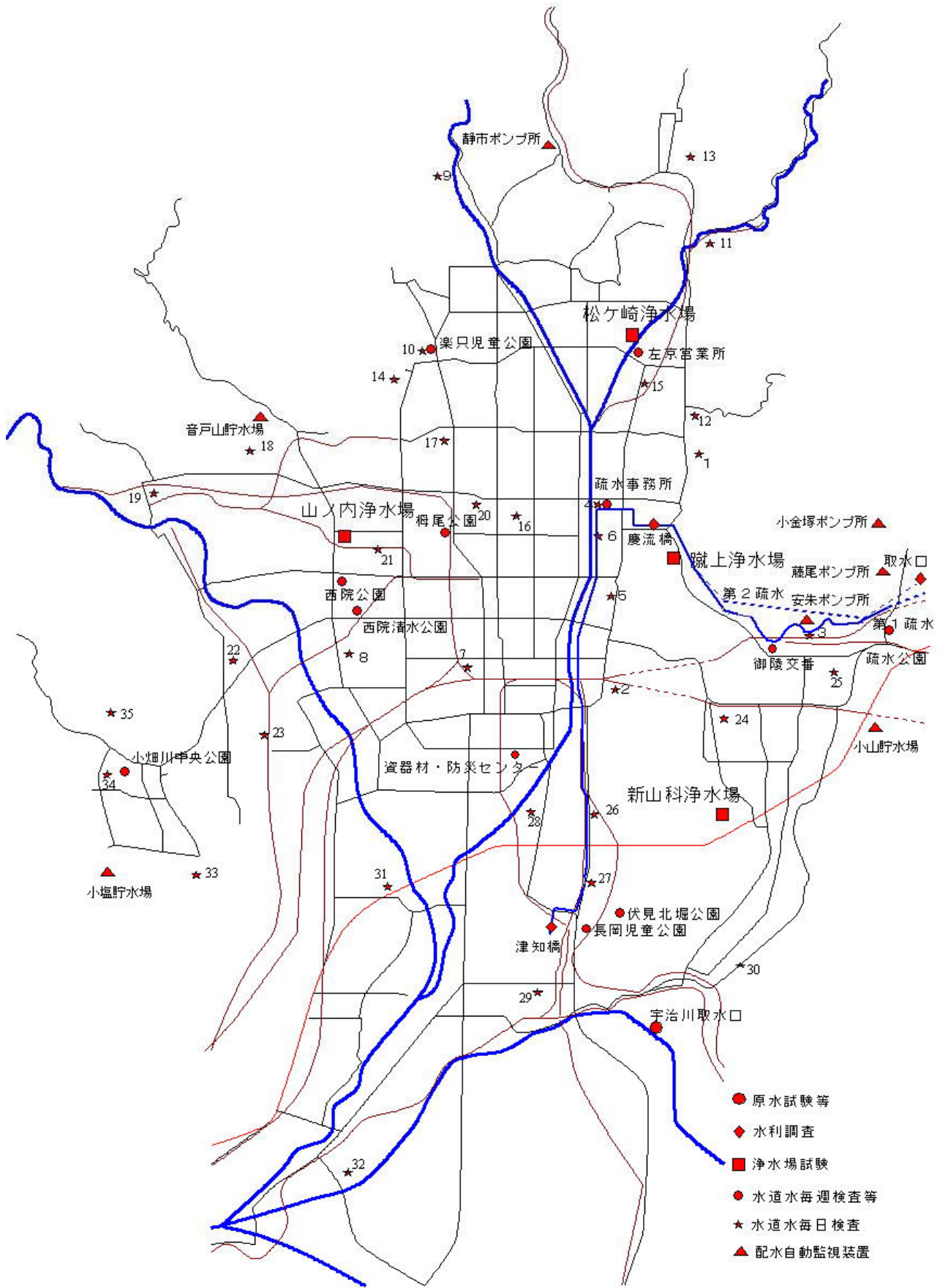
図一 1 市内採水地点