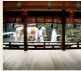
イメージ・上賀茂神社「白馬奏覧神事」

また帝が白馬が庭を通るのをご覧になる「白馬節会(あおうまのせちえ)」という行事も行われていました。