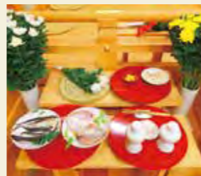
イメージ・貴船神社「菊花神事」

杯に菊花を浮かべた酒を飲むほか、菊に綿をかぶせて露で湿らせる行事が行われていました。