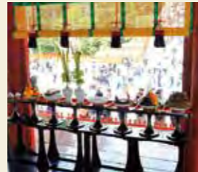
イメージ・鶴岡八幡宮「菖蒲祭」