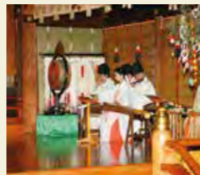
イメージ・大宮八幡宮「七夕の神遊び(技芸上達祈願祭)」