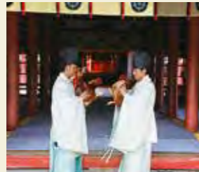
イメージ・津島神社「闘鶏転供祭」

幼年の宮に雛人形を献上する行事が行われていました。また鶏を闘わせる「闘鶏」という行事が行われていました。