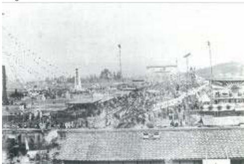
平安神宮地鎮祭の余興 (明治 26 年 [1893])