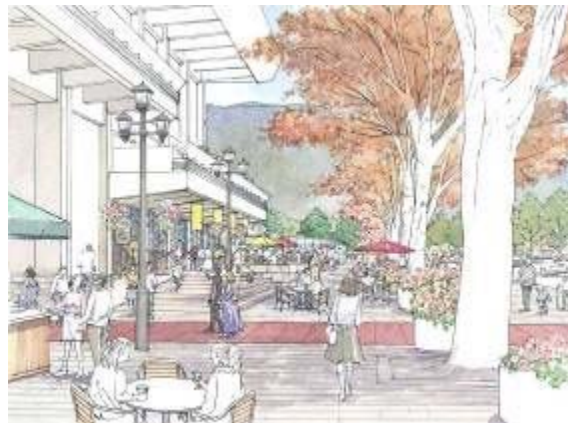
二条通り沿いの賑わい創出イメージ