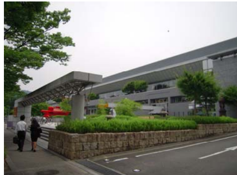
京都市勧業館 みやこめっせ