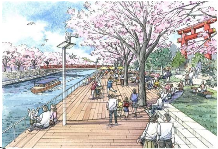
疏水辺のイメージ