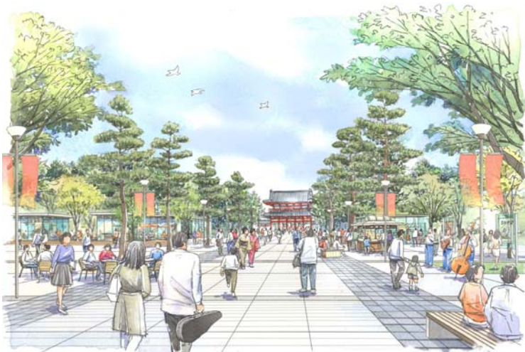
歩いて楽しい神宮道のイメージ