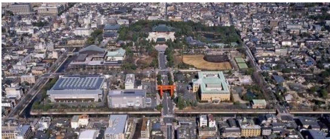
優れたデザインの近代建築物が集積するエリアの鳥瞰写真（平成 21 年撮影）