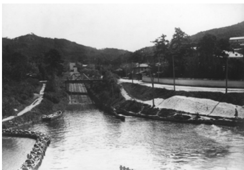
インクライン (大正期)