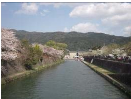
疏水から東山を望む

植治の庭をはじめとする疏水の水を引き入れた優れた庭園群を保全、将来へ継承するとともに、公開の機会を増やすなど国内外の方々にその魅力を伝えていく。また、ミュージアム、ギャラリーやMICE拠点（宿泊、パーティー、会合等）など、新たな活用を図りながら保全・継承できる仕組みについても所有者との連携の下で検討する。