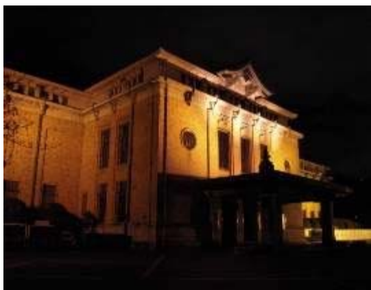
京都市美術館のライトアップ

岡崎地域に集積する美術館や博物館，有名社寺等に対して，ビジョンに掲げる将来像を実現するため，岡崎地域にふさわしい新たな憩い空間，賑わいの創出に向けた主体的な事業の企画を呼び掛けると同時に，各事業推進のための様々な支援を行う。