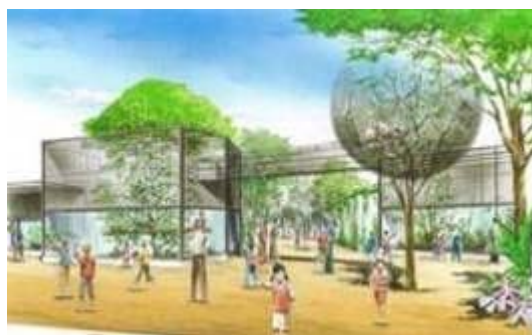
動物園の再整備イメージ