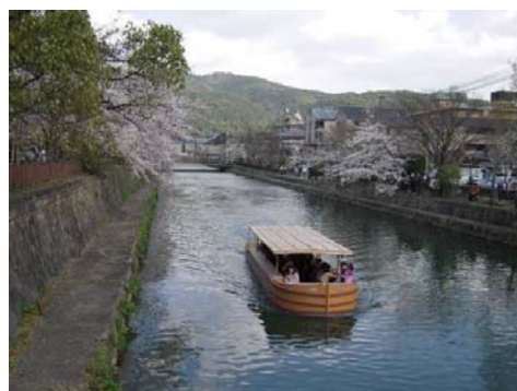
東山を借景とした疏水と十石舟