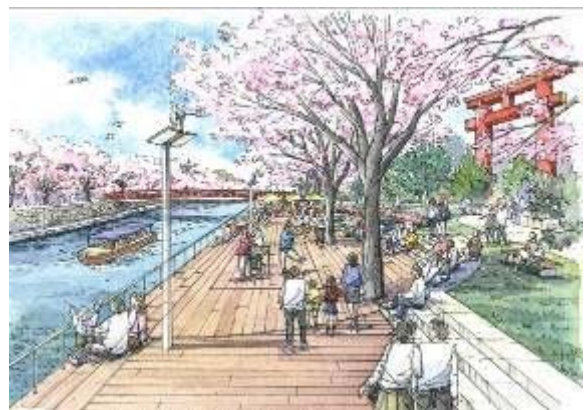
疏水沿いの親水空間のイメージ