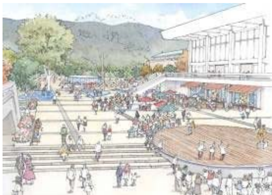
京都会館の再整備イメージ（中庭空間）