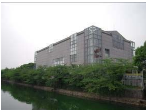
京都国立近代美術館