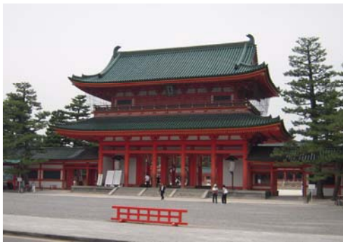
平安神宮・応天門