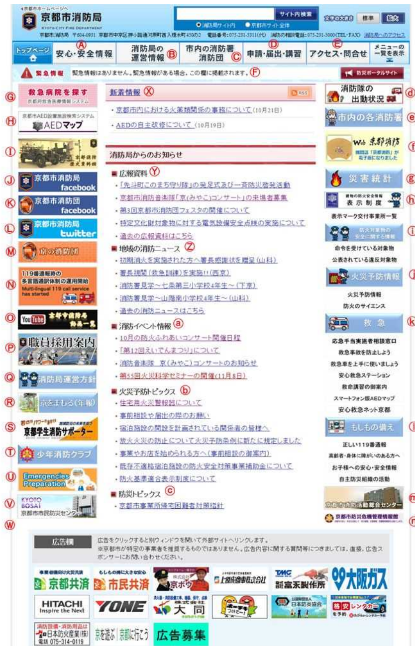
トップページの説明