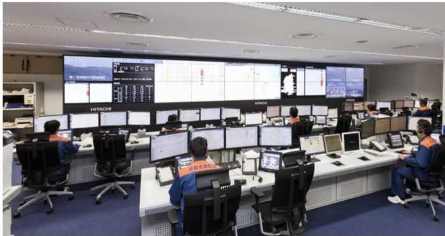
第三代消防指令システム（平成27年）