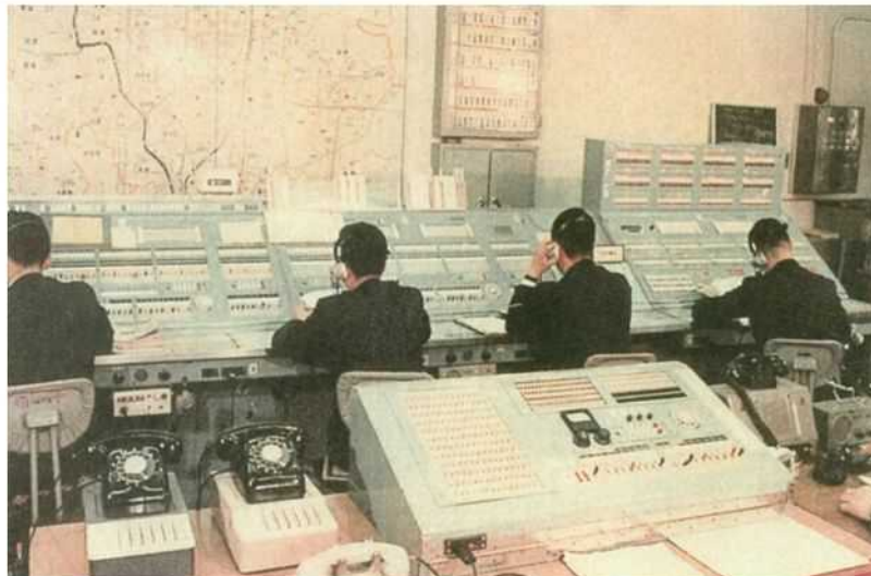
消防指令センター(昭和50年頃)