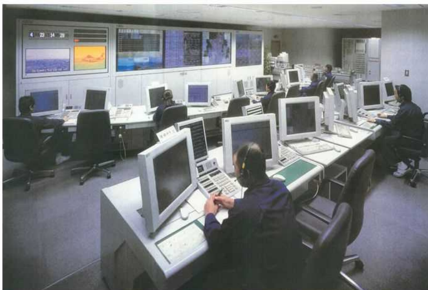
第二代消防指令システム(平成10年)

この第二代消防指令システムは、消防車等の位置をGPSによりリアルタイムに把握する車両動態管理システムを活用し、災害地点に最も近い車両順に出動部隊編成を行う「直近隊編成」や通報等を聞きながらコンピュータによる合成音声により自動指令を行う「自動音声指令」を全国で初めて導入しました。