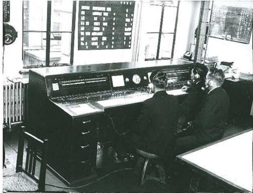
初代消防指令センター(昭和36年)