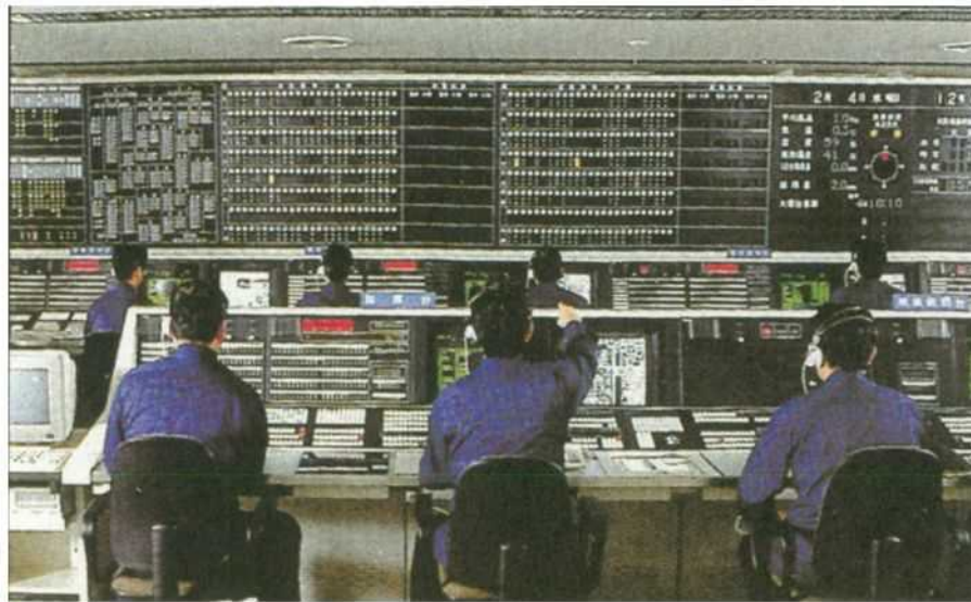
初代消防指令システム(昭和62年)

そして、昭和62年4月1日に消防指令システムの運用が開始され、災害発生場所の確認(発信地表示)、出動車両の編成と指令、現場情報や病院情報の提供など、119番通報の受信から消防車や救急車が災害発生場所に到着するまで、更なる時間短縮が行えるようになりました。