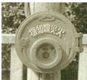
市内各所に設置されていた火災報知機。ボタンを押すとベルが鳴り、消防局に火災信号を送る。

このような時代のため、119番通報もあったとは思われますが、火災などの発見は、主に市内に設置された火災報知機、消防署等の望楼や消防署所への駆け付けでした。