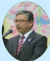
曾我 修 京都市会副議長