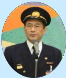
門川 大作 京都市長