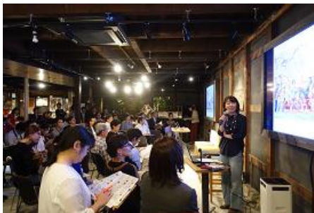
↑⑳vol.1「下京ではたらくこと」