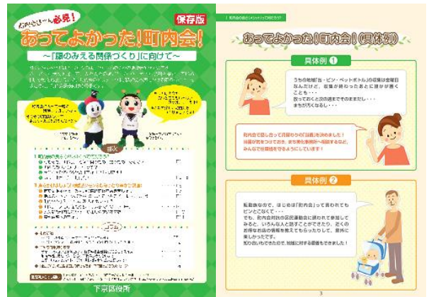
↑冊子「あつてよかった！町内会！」

今年度は、この冊子を活用し、町内会の加入を促進することで、下京区の「顔のみえる関係づくり」を支援します。