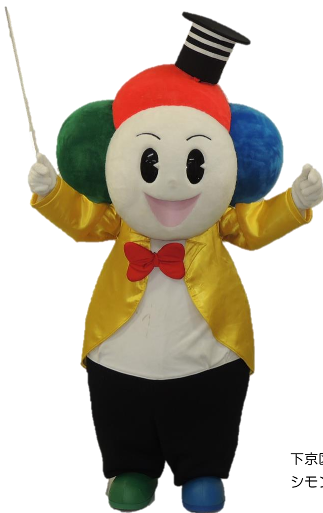
下京区のマスコット シモンちゃん