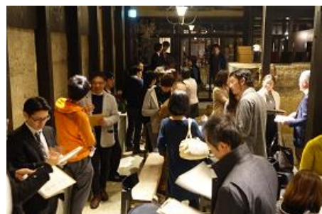
㉑vol.2「地元をフランチングすること」↑