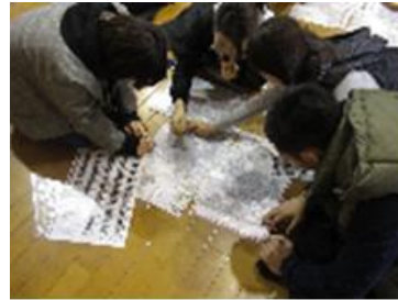
←観光型スポーツ「京・フォトロゲイニング」 【参加者：28289人】