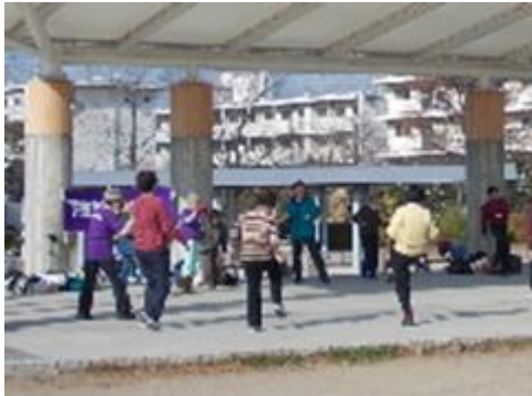
←健康づくりサポーター「しもけんズ」 毎週金曜日（2・8月と雨天時除く）に 梅小路公園でメタボ予防体操実施中