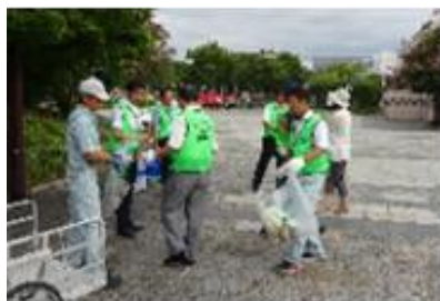
←月に一度の合同清掃活動 （京都・梅小路みんながつながるPJ） 【28延べ1,139人参加】