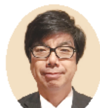
下京区長 廣野 貴夫

区制 140 周年が、2 年後と目前になってまいりました。御意見をお聴きしながら取り組んでまいりますとともに、引き続き、京都市政、下京区政への皆様の御支援、御協力をよろしくお願いいたします。