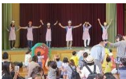
←↑親子で遊ぼう！下京たんぽぽ広場 【参加者：②374人→⑳446人】