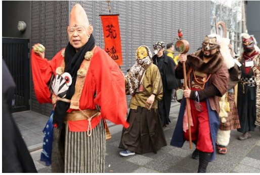
昨年の節分お化け☆百鬼夜行のパレード