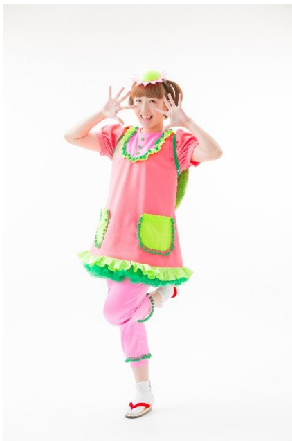
今年は岩手県から「河童ちゃん」（写真左）と徳島県から妖怪たちが参加します。