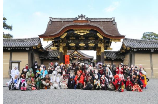
二条城唐門前での記念写真