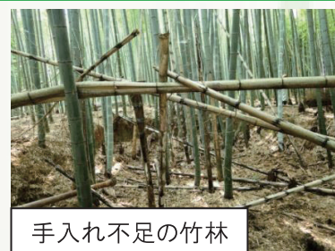
手入れ不足の竹林