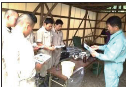
■高等学校での指導

本市の伝統産業のひとつである「和蝋燭」の原料・「櫨蠟」の枯渇が、全国的に危惧されていることから、本市では右京区京北地域において、民間企業や教育機関、研究機関等と連携し、蠟を採取する櫨の木の育成に取り組んでいます。 売上げの一部を京北地域の森づくりに役立てる商品が(有)中村ローソクから販売されたり、京都府立北桑田高等学校では生徒が櫨について学び、実際に苗木の移植作業等を経験するカリキュラムが組まれるなど、本取組の輪は地域へも広がっています。 今後、本取組は中山間地域の新たな地域資源として、総合所得の向上や紅葉による美しい景観づくりに貢献することが期待されます。