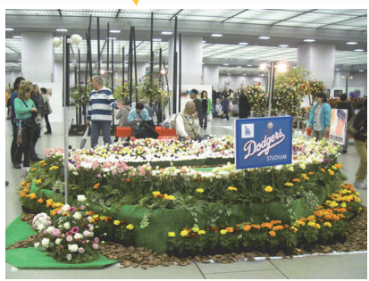
WBCの日本優勝を記念し、決勝戦が行われたドジャースタジアムを表現した大装飾花

第40回花と緑の市民フェアが4月25日（土）・26日（日）の2日間、左京区岡崎の京都市勧業館（みやこめっせ）で開催されました。会場では、ひととき目を引く大装飾花、洗練された切花・鉢物、装飾品のほか、特別企画の小学校花壇の写真展示、京都発祥の観葉植物のコーナーが人気を集めていました。