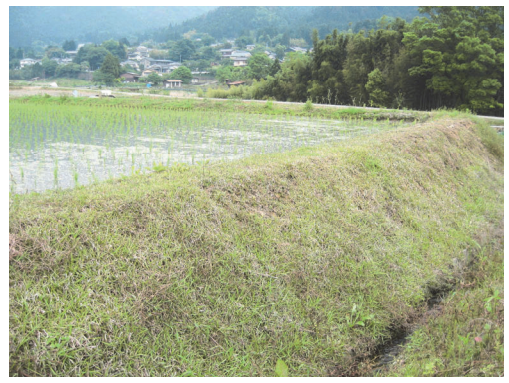
（写真1）ぼ場整備後の法面に施工したセンチピードグラス2年目の状況（左京区大原）

注意点は、法面上部を中心にまき付けることと、施工後2、3年（芝が法面を覆うまで）は年3回程度地際5cmほどを残して草刈りをする事です。芝が法面を覆うと、雑草の成長が抑えられ、年1回程度の草刈りで法面管理が行えます。