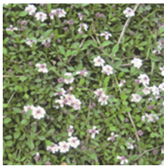
（写真2）ヒメイワダレソウ

ほかに、グラウンドカバープランツとして利用できるものには、ヒメイワダレソウ（写真2）やシバザクラ、スイセン、ナデシコなど