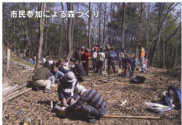
市民参加による森づくり