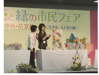
花のある生活スタイルを提案

第40回花と緑の市民フェアが4月25日（土）・26日（日）の2日間、左京区岡崎の京都市勧業館（みやこめっせ）で開催されました。会場では、ひととき目を引く大装飾花、洗練された切花・鉢物、装飾品のほか、特別企画の小学校花壇の写真展示、京都発祥の観葉植物のコーナーが人気を集めていました。