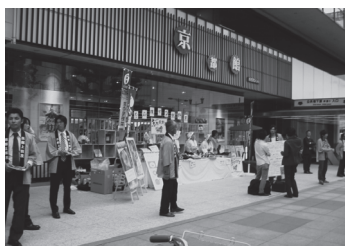
「本場・京都洛北の賀茂なす東京PR大作戦」の様子

今年5月17日(日)には、東京にある京都市の総合情報館「京都館」にて『本場・京都洛北の賀茂なす東京PR大作戦』を上賀茂特産野菜研究会と京都市農協上賀茂支部が共同で開催し、会員が持ち寄った賀茂なす200個を販売するなど、本場のこだわりを発信しました。