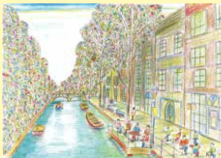
第24回心ときめき芸術祭 ポスター募集作品