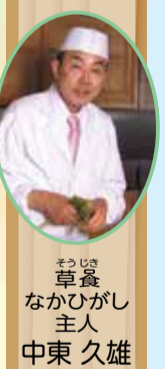
草食 なかひらがし 主人 中東 久雄