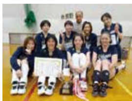
市原野体振チームの皆さん