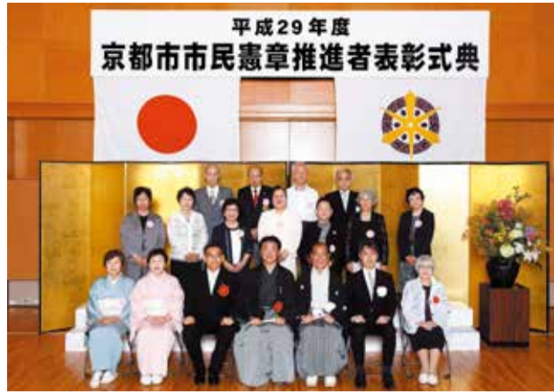
市長表彰（6月15日開催）

市民憲章推進者 市長表彰・区長表彰 本市では、京都市市民憲章を永年にわたり率先して推進され、市民の模範となる実践活動に取り組み続けてきた方々を表彰しています。 市長表彰式 6月15日 ひと・まち交流館京都で、左京区から11名の方々と2団体が門川市長から表彰 区長表彰式 5月26日 区役所で、61名の方々と6団体が浅野区長から表彰