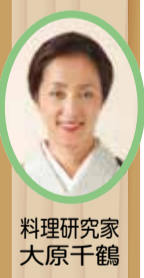
料理研究家 大原千鶴