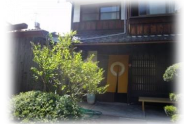
【竹中庵と水車水路跡】