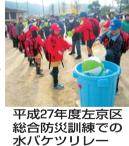
平成27年度左京区総合防災訓練での水バケツリレー

子どもと共に育む防災 日本は、火山活動や地震活動の多発国です。また、世界的な気候変動の影響か、台風やゲリラ豪雨に加え、最近はやや急激な暴風雨など、毎年、甚大な被害が発生しています。京都市においてもここ数年、毎年のように水害が発生しています。左京区でも昨年7月の台風11号による土砂災害が記憶に新しいところで、今や、すべての市民が生活習慣の一部のように防災に関する知識を身に付ける必要があるのではないのでしょうか。そのためには子どもの時期が肝心。遊びの感覚で防災について親しむうちに、自然と知識が身につけてゆけば良いですね。地域で行われる防災訓練も、最近では救済訓練に可愛い