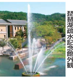
琵琶湖疎水記念館外観