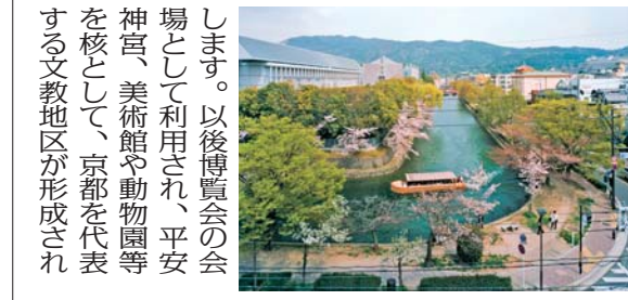
東山を借景に琵琶湖疏水を望む 「京都岡崎の文化的景観」の選定を機に、優れた景観を伝えるため、さらなる取組を進めていきます。 問合せ 市文化財保護課(☎366-1498)

「京都岡崎の文化的景観」が国の重要文化的景観に選定されました 平成27年10月7日付で、「京都岡崎の文化的景観」が国の重要文化的景観に選定されました。京都岡崎の地は、平安京の東を流れる鴨川と東山の山並に挟まれた地で、豊かな水を背景に、平安末期には院政の場となった白河殿や六勝寺などが、幕末には諸藩の藩邸施設の建設地として利用されてきました。明治23年に琵琶湖の水を引き込む琵琶湖疏水が開削され、水力発電や舟運に關する諸施設が設けられました。南禅寺界隈にはその水を庭園に利用した一大別邸群が形成され、いわば西洋的な技術を和の美に昇華した景観が現出