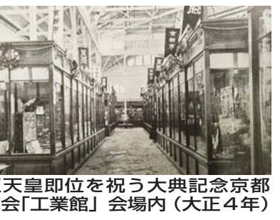
大正天皇即位を祝う大典記念京都博覧会「工業館」会場内(大正4年)