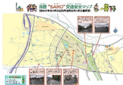
▲京都市立新林小学校