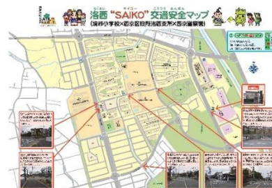
▲京都市立境谷小学校