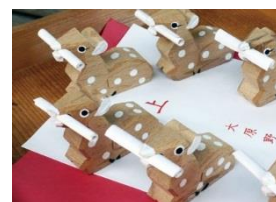
大原野神社朱印帳