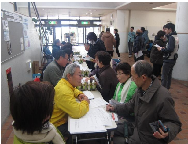
被災者ニーズを把握する訓練