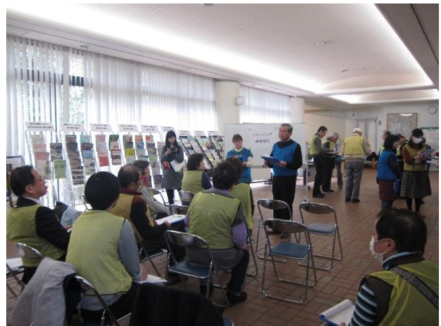
ボランティアのコーディネート訓練