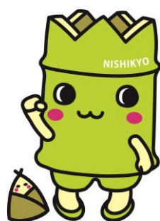
西京区マスコットキャラクター 「にしきょう・たけによん」