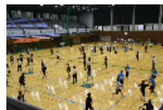
バレーボール・ソフトバレーボール祭

体育振興会連合会等によるバレーボールやソフトバレーボール, ソフトボール, ゲートボール等の大会の開催を支援します。