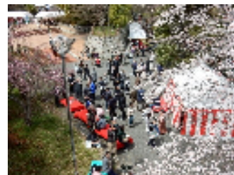
らくさいさくら祭

洛西地域の商業施設の発展及びコミュニティの活性化を図るため, 恒例行事として定着している「らくさいさくら祭」を地域の事業者と協働で開催し, より活気あふれる地域づくりを進めます。