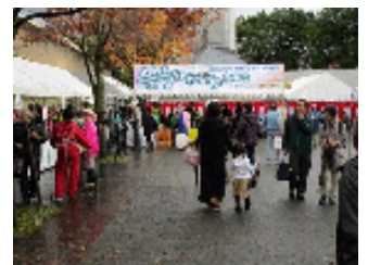
西京区民ふれあいまつり

西京区民ふれあいまつりや春・秋の文化作品展、俳句教室、短歌教室等の「西京区民ふれあい事業」を通して区民全体のふれあいを図り、西京区の活性化を推進します。