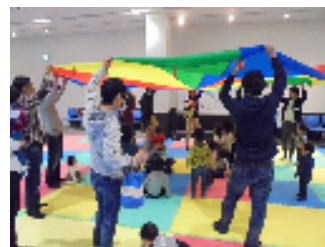
地域で育児！！ 西京パパ塾

(総務・防災担当、子どもはぐくみ室、久世保育所) 育児を頑張るパパ達と子ども達との絆を深めてもらい、またパパ同士の交流の場を提供するため、「西京☆パパ盛り上げ隊」(地域有志のパパたちによるグループ)とともに子育て支援イベントを開催します。