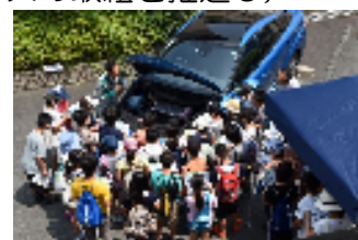
子ども環境教室（燃料電池自動車見学）