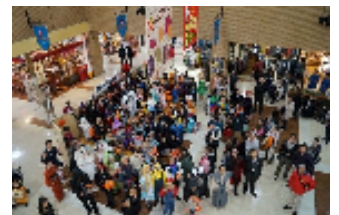
洛西グラシアス・バル （洛西夜の賑わい創出プロジェクト）

既存の地域活動と連携を図り、若い世代・子育て世代を対象とする「洛西グラシアス・バル」等を開催し、洛西の魅力を広く発信し、移住・定住促進に繋げる仕組みを作ります。