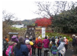
健康づくりサポーターと歩く 洛西ウォーキングラリー

区民の皆様の健康づくりや生活習慣病の予防などについて、保健センターと一緒に活動する健康づくりサポーターを養成します。