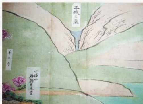
大原野神社所蔵 王城の滝図