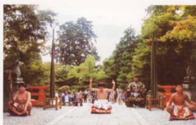
少年横綱土俵入り奉納