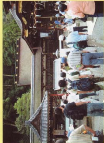
フィールドワークの様子