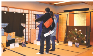
地域拠点「本能館」活用大作戦 (立命館大学 乾ゼミ)