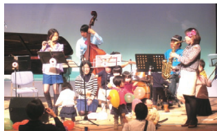
ファミリーコンサート〜きれいな音の贈り物〜 (音楽療法ゆる〜り)

今回は、平成25年度中京区民まちづくり支援事業補助金交付団体の 皆様がテーマ提案者として10前後のテーブルを持ちます!