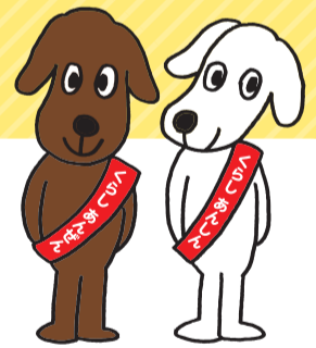
くらしあんぜんワン くらしあんしんワン

みんなが安全・安心に暮らしていくために、「地域を見守る目」を意識してみませんか。