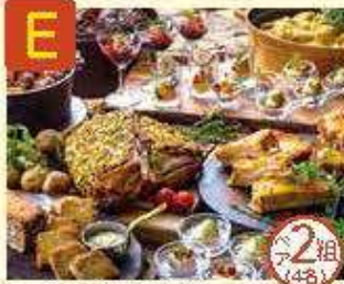
E リーガロイヤルホテル 京和 オールデイダイニング カザ ヘアランチbuffet