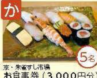
か 京・朱雀すし市場 お食事券 (3,000円分)