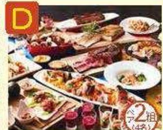
D 京和 センチュリーホテル オールデイダイニング ラジヨウ ランチbuffet お食事券