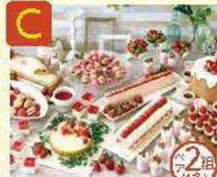
C ホテルグランドヴィア 京和 毎づくりのスイーツバイキング