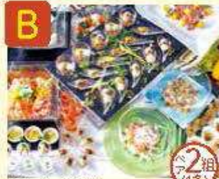
B 和ホテル 京和八条 バイキングレストラン [ル・プレジール] ランチbuffet