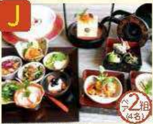
J ホテル エルシエント 京和 下京・南まちなかアート特別ペアディナー券 ※メニュー内容は季節により異なります