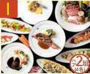
I 京和 東急ホテル オールデイダイニング 風花 ランチhalf buffet