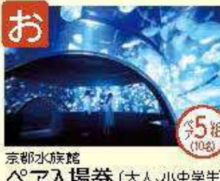
お 京都水族館 ペア入場券 (大人、小中学生)