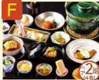
F ホテル エミオン 京和 ショップ&レストラン 京旬菜 [南笑] ディナーコース 食事券