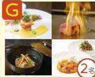
G ホテル日航 プリンセス 京和 ホテルレストランご利用券 10,000円分