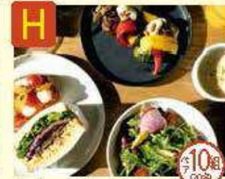
H ホテル アンテルーム 京和 朝食券