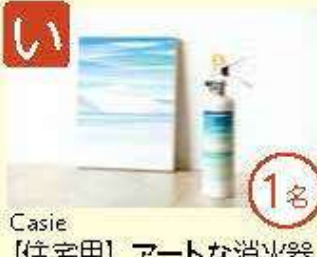
い Casie [住宅用] アートな消火器 (masanao taniguchi)