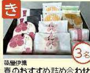
き 篠屋伊織 春のおすすめ詰め合わせ