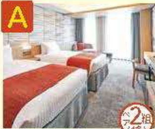
A ホテル エミオン 京和 宿泊券 スタンダードルーム 31㎡