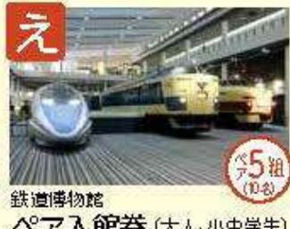
え 鉄道博物館 ペア入館券 (大人、小中学生)