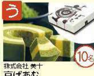
う 株式会社 美十 京ばあむ