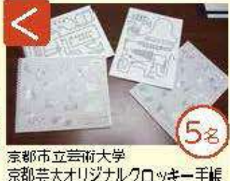
く 京都市立芸術大学 京都芸大オリジナルクッキー手帳