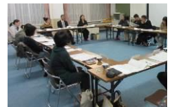
2校PTA代表者会 (第3回) 27.10.29

また、教育委員会からは、「新校舎の設計作業が順調に進んでいる」との報告がありました。