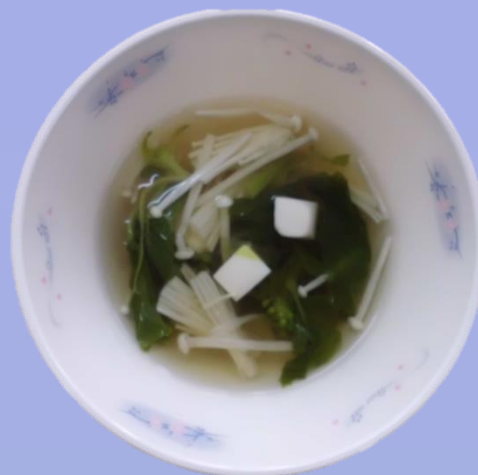
はなのすましじる