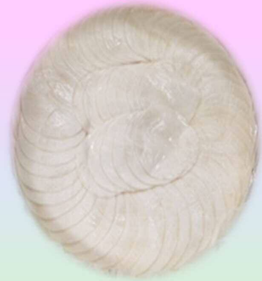
せんまい づけ 漬