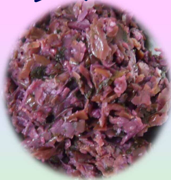
しば づけ 漬