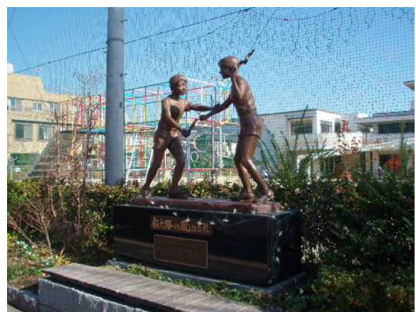
大文字駅伝 記念像

こうして始まった「大文字駅伝」大会も、関係機関の方々の多大なるご理解とご協力によって今大会までに回を重ねてきました。その中には、京都市の小学生のみならず、姉妹都市の小学生も招待して国際交流を深めた第8回大会や、阪神・淡路大震災からの復興を願って、神戸市の小学生を招待して行った第10回大会もありました。このように回を重ねるごとに、多くの市民の皆様から応援を得つつ、時代を反映して変化し、今や京都の冬の風物詩ともいえる大会に成長してきた「大文字駅伝」大会ですが、「子ども達の生涯の思い出となる大会になってほしい」という当初の思いは現在でも生き続けています。