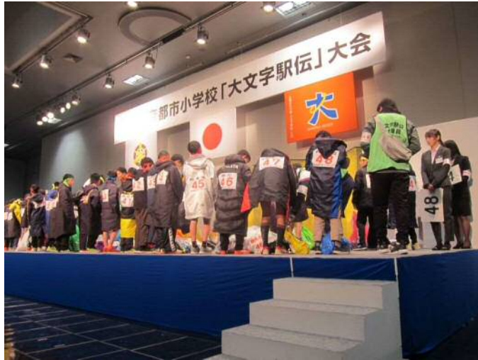
【選手送り出しに並ぶ選手】