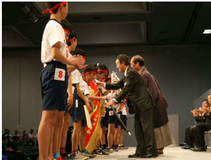
【優勝の表彰を受ける朱雀第三小の選手】