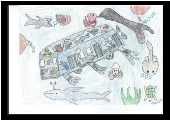
【高山 すばる 様 作】

ヒレのついた不思議な乗り物が、ユーモラスな海の生き物の間を抜けて悠々と進んでいく姿がとても面白く魅力的です。乗り物には沢山の海の生き物が描かれ、こんな地下鉄に乗って海底に行ってみたいな！という作者のわくわくした気持ちが伝わってくる楽しくて夢のある作品だと思います。