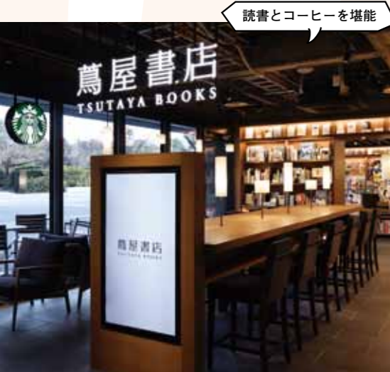
読書とコーヒーを堪能