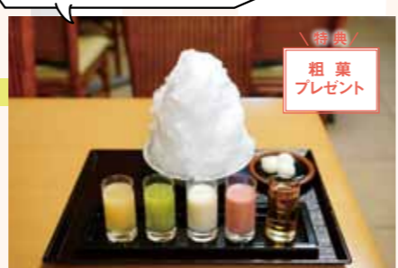
特典 粗糶プレゼント