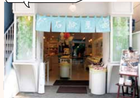
店内で気軽に試せるのがうれしい