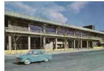
建設当時の京都会館

昭和35年(1960)、全国に先駆けた多目的公立文化ホールとして誕生した京都会館。当時京都市の財政は厳しい状況でしたが、市民の強い要望もあり、寄付金などによって建設が実現しました。その後長らく市民や全国のアーティストから親しまれてきましたが、開館