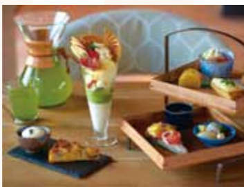
「京都モダンテラス」では、グリル料理やスイーツが楽しめる