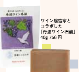
ワイン醸造家とコラボした「丹波ワイン石鹸」40g 756円