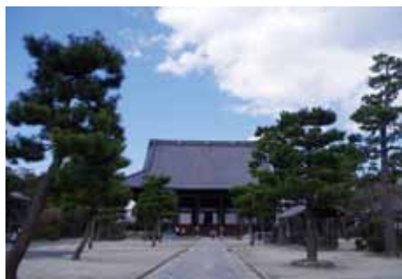
手づくり市は御影堂で行われる大念珠繰りの日に開催