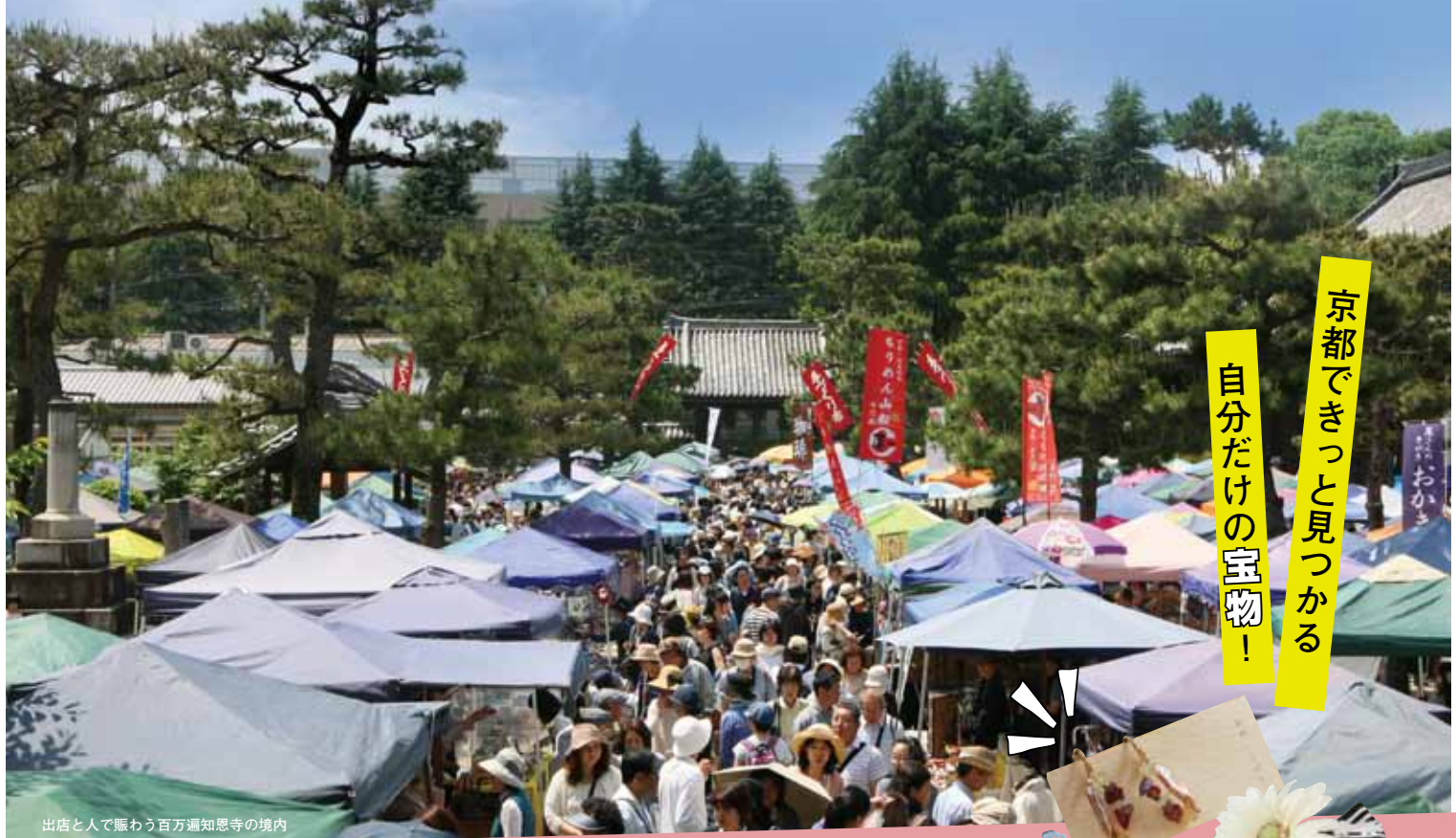
出店と人で賑わう百万遍知恩寺の境内