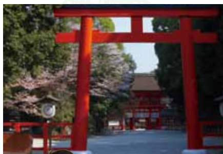
ヤマザクラをバックにした南口鳥居