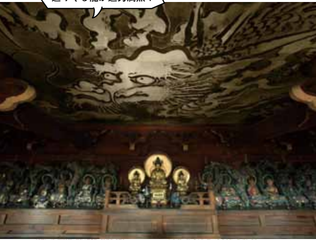
山門楼上内部の「蟠龍図」