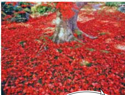
紅葉が色づく獅子吼の庭

☎075-861-0091 ☺9時～17時(庭園受付は16時45分まで、本堂受付は16時30分まで) ㊟500円(本堂特別公開は別途500円) 地下 太秦天神川駅から徒歩11分・特93 嵐山天龍寺前(嵐電嵐山駅前)下車、徒歩約5分 ※京都駅からは、JRを利用すると乗換なしで便利(㊟嵯峨嵐山駅下車、徒歩約10分)