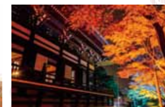
夜間ライトアップも行われる