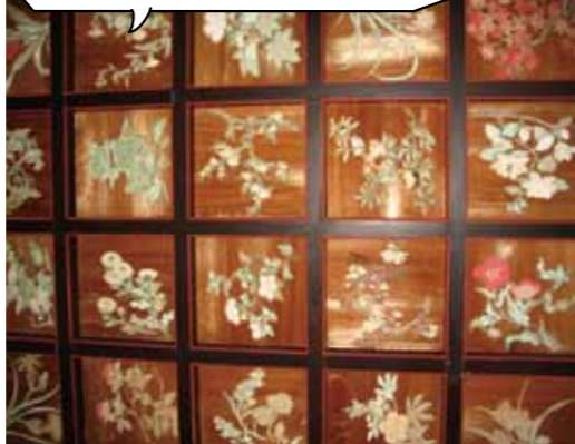
春と秋に特別公開される「花の天井」