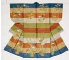
段四季草花紋縫箔

☎075-751-0374 ☎10時～16時30分(入館は16時まで) 図800円 図月曜