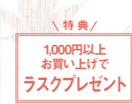
特典/ 1,000円以上お買い上げでラスクプレゼント