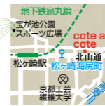
特典/ 1,000円以上お買い上げで10%OFF