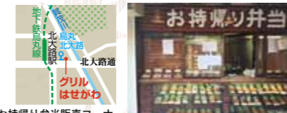
お持ち帰り弁当販売コーナー