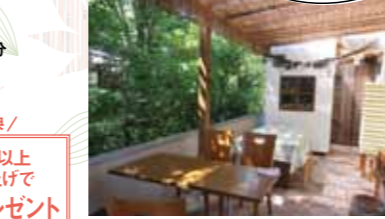
木漏れ日が差し込むイートインスペース