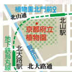
広々とした大芝生地

☎075-701-0141 🕒9時~17時(入園は16時まで) 🎫200円 🗓12/28~1/4 🚇地下 北山駅下車、または市バス北8 📍植物園北門前下車すぐ