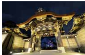
昨年のライトアップ(唐門)