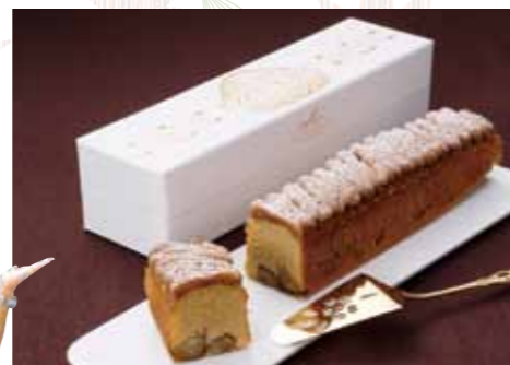
「ケーキモンブラン」2,484円 ※京都北山本店にて9/8(土)～11月末までの限定発売予定

本誌をご提供いただいた方に、上記店舗にて「特典」をご提供いたします！記載のない店舗では特典提供はありません。期間：平成30年9月14日(金)～10月14日(日) ※他券・他サービスとの併用不可