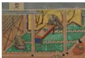
親鸞聖人絵伝(部分) / 高山別院照蓮寺(高山市)蔵