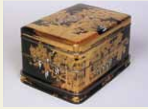
迎田秋悦 彩羅時繪重提箱 大正9年

丸太町通 平安寺神宮 岡崎公園 美術館・平安寺前 京都市 平安寺前 京都国立近代美術館 丸太町通 地下鉄東西線 東山駅 三条通 ☎075-761-4111 ◎9時30分~17時 (入館は16時30分まで) ◎900円 ☾月曜(7/21は開館)、 7/22