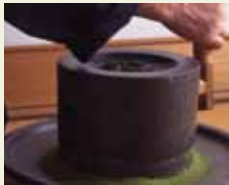
茶臼をひく体験 などが楽しめる

多彩なワークショップや講座を取り入れた体験型展覧会。「又隠(ゆういん) 写し茶室体験」、「茶臼体験と抹茶生産工程を知る講座」、クイズラリーなど、親子で楽しめるイベントが満載(講座により予約や別途料金が必要)。