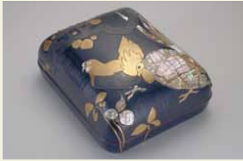
浅井忠・案 杉林古香、作 《鶴梅時験文庫》明治39年、 京都国立近代美術館

丸太町通 平安寺神宮 岡崎公園 美術館・平安寺前 京都市 平安寺前 京都国立近代美術館 丸太町通 地下鉄東西線 東山駅 三条通 ☎075-761-4111 ◎9時30分~17時 (入館は16時30分まで) ◎900円 ☾月曜(7/21は開館)、 7/22