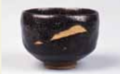
三代道入 山ノ端 黒樂茶碗

長次郎茶碗を本源に、450年の伝統を今に受け継ぐ樂茶碗。琳派の祖・本阿弥光悦から創造の魂を受け取った三代道入、現代琳派に通じる十五代吉左衛門の多様な裝飾表現など、楽歴代が時代を追って模索した裝飾的試みに迫る。