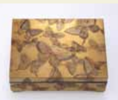
群蝶蒔絵小箱 / 遊民 9.3 x 12.3 x 4.0 cm

繊細できらびやかな裝飾が施された、手の平サイズの蒔絵の小箱。鎖国の開けた19世紀には西洋人たちをも魅了し、おびただしい数の作品が海を渡っていったという。欧米より里帰りした作品を含む約60点の華麗な世界が広がる。